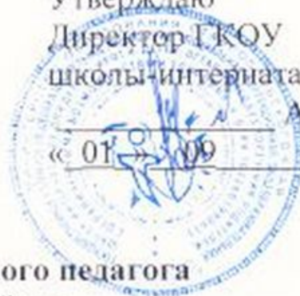
График работы социального педагога 2018-2019 учебный год